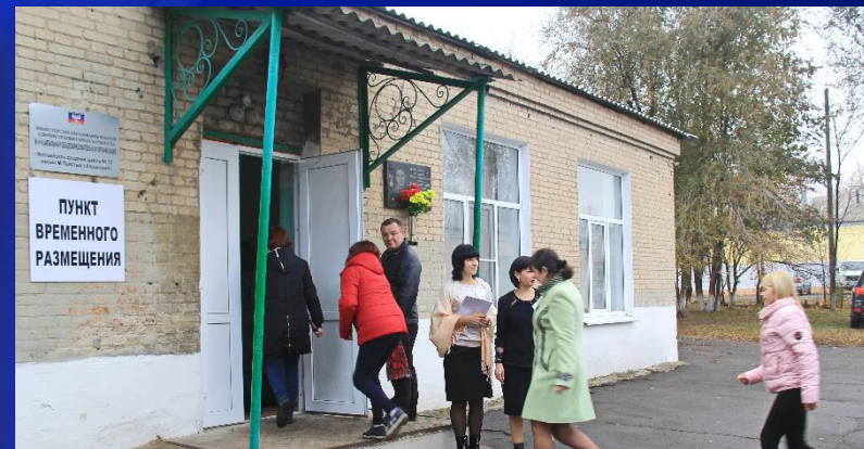
Пункт временного размещения