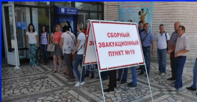
Сборный эвакуационный пункт